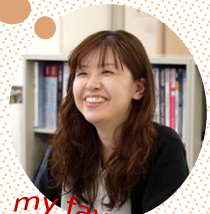
my favorite book

私のおすすめは、「栄養まるごと10割レシピ!」という料理・レシピ本です。忙しく働いて帰ってご飯を作るのが面倒くさい!と、おかずの作り置きをしたり、食材を冷凍したり、調理しやすいカット野菜を購入したりする方、たくさんいらっしゃるのではないかと思います。この本は、加熱しすぎ、時間をかけすぎ、空気に触れすぎ、大事な部分を捨てすぎによって、いかに食材の栄養が失われてしまうか(例えばカットトマトはまるごとより酸化が5倍も早い、切れない包丁は栄養が1/2にダウン!など)、また、栄養を手間なく無駄なく取るにはどのような調理法が適しているかを紹介している本です。レシピも多数掲載されています。“こういう調理をしていると、せっかくの栄養が食べる頃には0%減少してしまう”という話がありにもたくさん載っているので、普段の自分の料理の仕方では、かなりの栄養がロスしているのでは?と恐怖を覚えました。皆様も、一度振り返ってみてはいかがでしょうか。